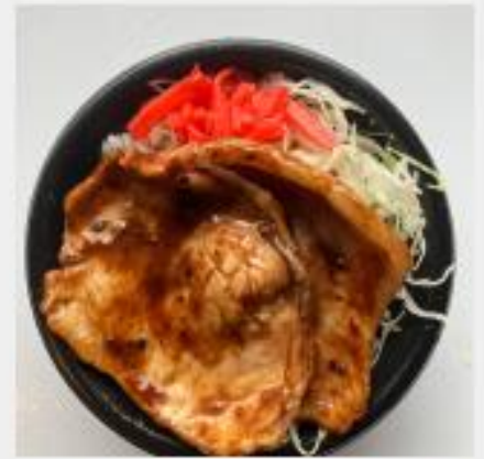
ミニチャーシュー丼

柔らかチャーシューが乗った 幸せミニ丼 ミニと言っても200gは 普通の店の小ライス量