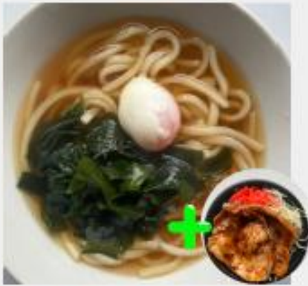
温玉ワカメうどん