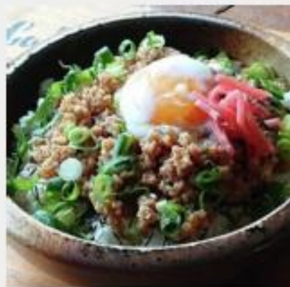
ミニ温玉肉味噌丼